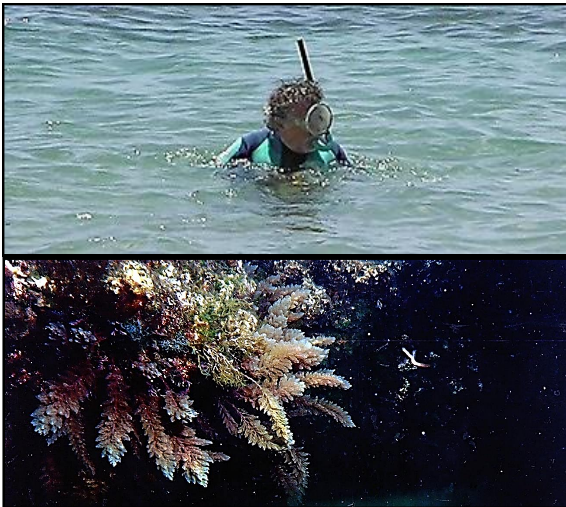
Playa de Las Canteras- Gran Canaria – Fotos en apnea -